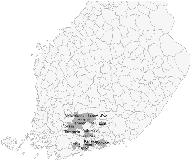
KUVIO 2. FUAS-ammattikorkeakoulujen toimipisteet Etelä-Suomen läänin alueella

Liittoumaan kuuluvien ammattikorkeakoulujen toimialueet sijaitsevat Etelä-Suomen läänin alueella siten, että kuvan alareunassa ovat Laurea-ammattikorkeakoulun toimipisteet Lohjalta Porvooseen. Vasemmassa yläkulmassa ovat Hämeen ammattikorkeakoulun alueen toimipisteet ja Lahden ammattikorkeakoulun toimipisteet sijaitsevat kaikki Lahden kaupungin alueella.