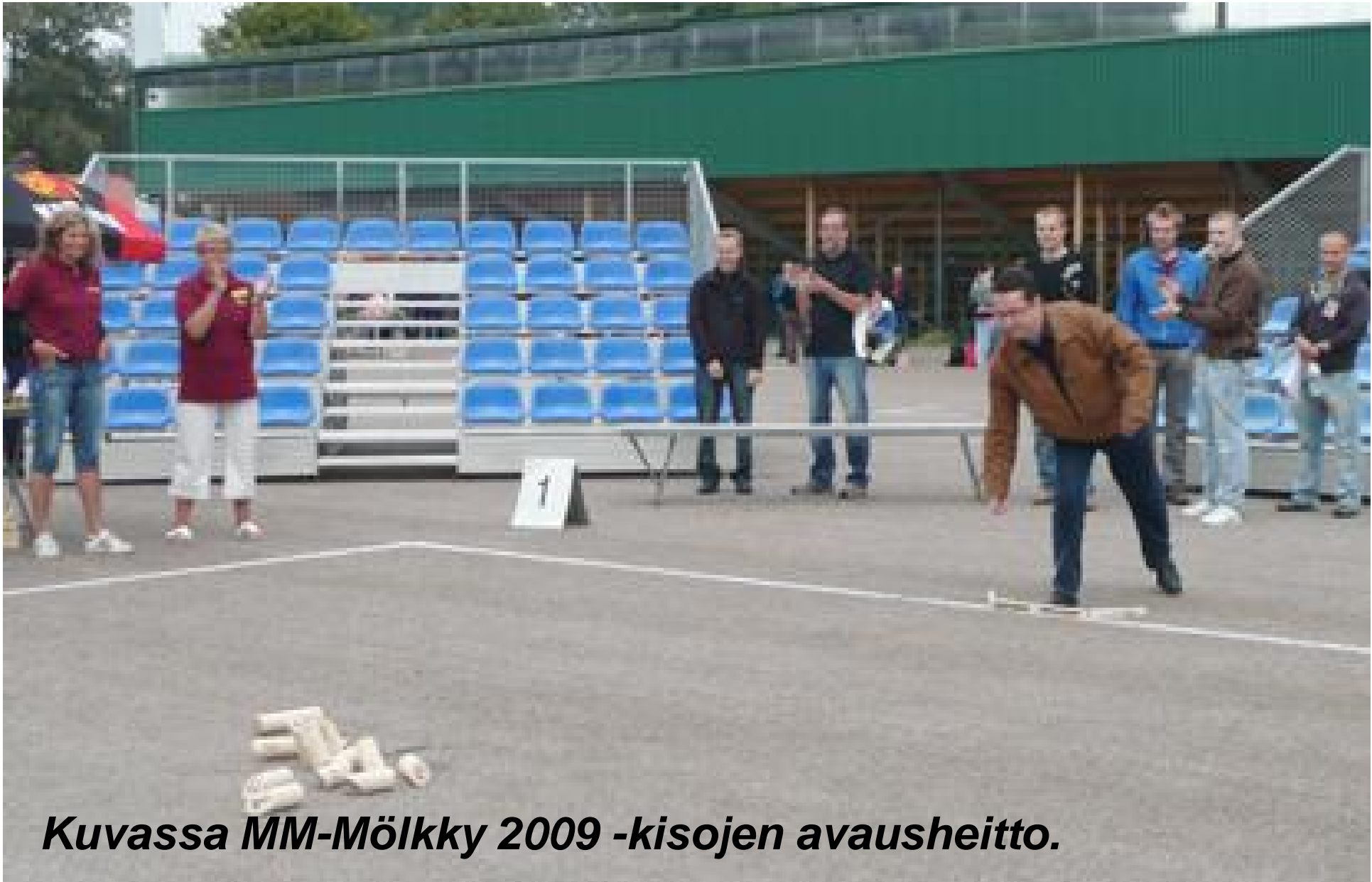
Kuvassa MM-Mölkky 2009 -kisojen avausheitto.